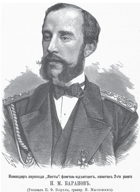
Командир парохода „Весты“: флигель-адъютант, капитан 2-го ранга Н. М. БАРАНОВЪ.

Очерк написан очень живо и эмоционально, со множеством деталей и подробностей. И хотя он называется «Капитан 2-го ранга Н.М. Баранов, и бой парохода „Весты“ с турецким броненосцем», в нём приведены фамилии и других героев и кратко описаны их действия. Так, например,