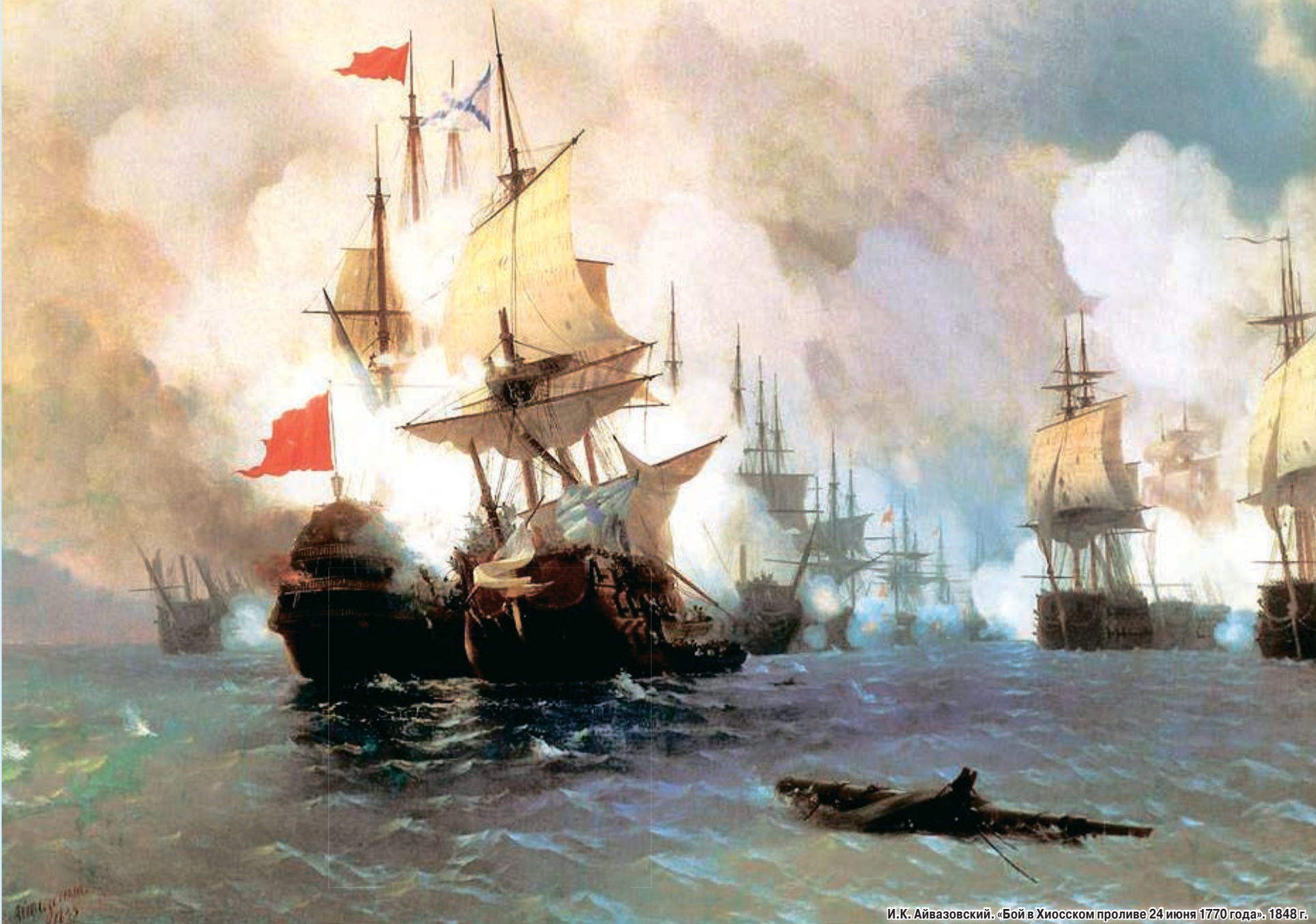
И.К. Айвазовский. «Бой в Хиосском проливе 24 июня 1770 года». 1848 г.