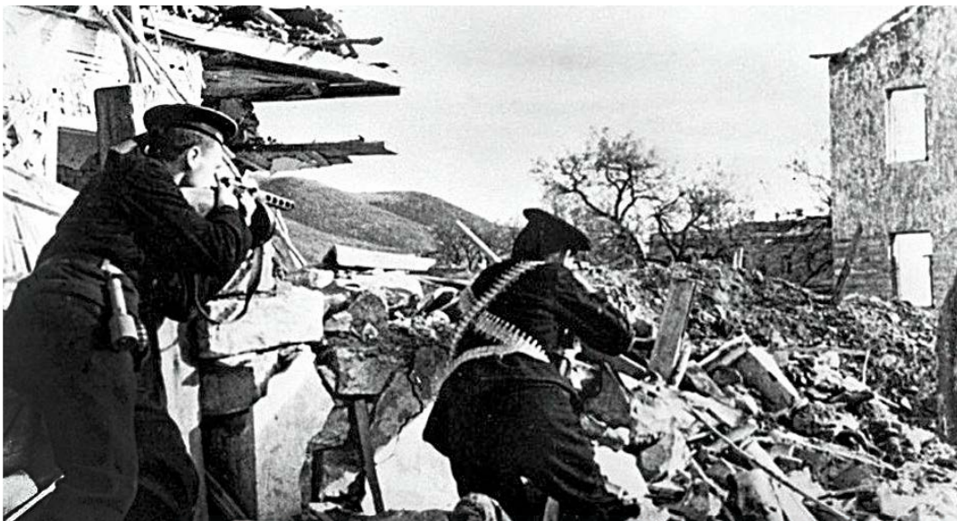
Бойцы морской пехоты сражаются на улицах Севастополя. 22 мая 1942 г.

«На этой священной земле краснофлотцы и красноармейцы дрались до последней капли крови, — отметил на митинге контр-адмирал Юрий Ореховский. — Защитники совершили 75 лет назад беспримерный подвиг, показав своей отвагой и