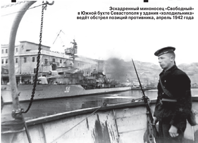
Эскадренный миноносец «Свободный» в Южной бухте Севастополя у здания «холодильника» ведёт обстрел позиций противника, апрель 1942 года

номорья. Мы восхищены вашей беспримерной борьбой с полчищами коричневой чумы. Твёрдо уверены, что вы отстоите родной город.