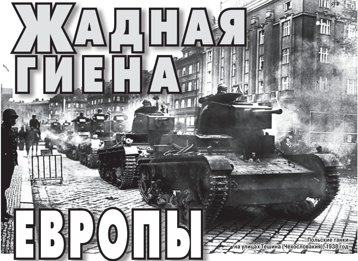
Польские танки на улицах Тешина (Чехословакия), 1938 год