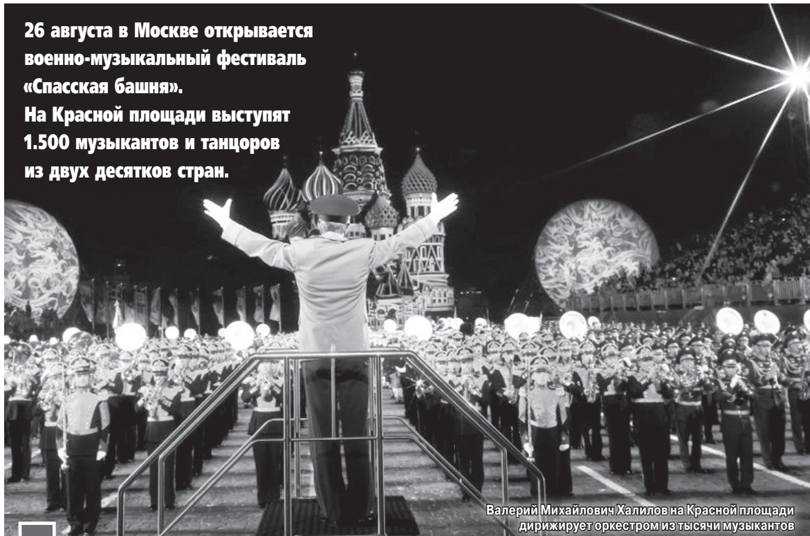
Валерий Михайлович Халилов на Красной площади дирижирует оркестром из тысячи музыкантов

На Красной площади выступят 1.500 музыкантов и танцоров из двух десятков стран.