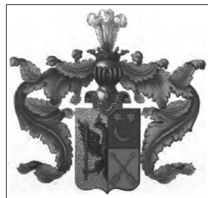
Герб рода Поливановых

рал-майора (произведён за отличие в 1899 г.) 4 , достигшего всего за полтора года поста помощника (товарища) военного министра империи. В этой должности