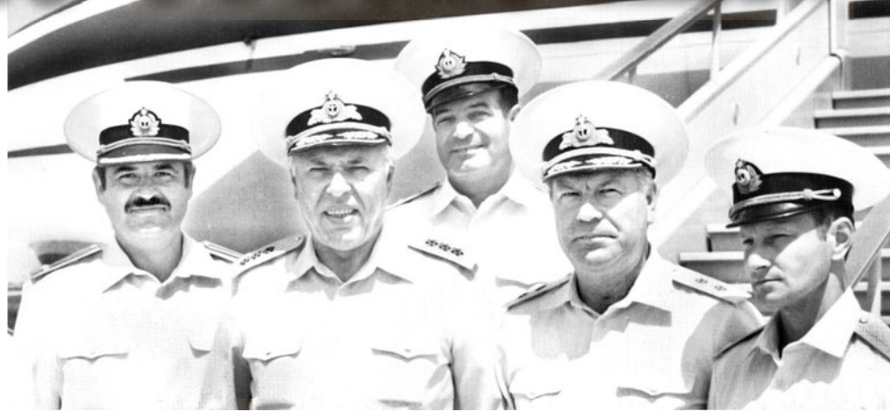
Делегаты XXVIII съезда КПСС перед вылетом в Москву