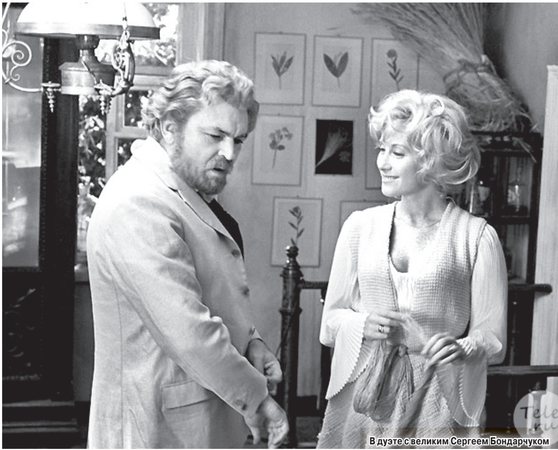
В дуэте с великим Сергеем Бондарчуком