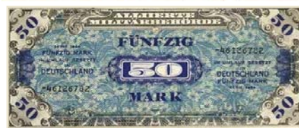
Военные деньги: венгерская пенге и немецкая марка, бывшие в ходу на территории иностранных государств во время ВОВ

22 августа 1941 года Постановлением Совета народных комиссаров было дано разрешение на создание Управления полевых учреждений Госбанка СССР. Этот день считается Днем создания системы полевых учреждений Центрального банка страны.