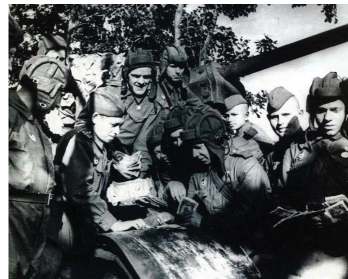
На передовой танкисты подписываются на военный заём

> 50% к июлю 1942 г. > 76,5% к началу 1943 г.