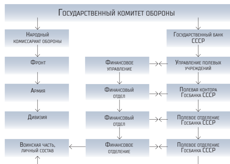
СХЕМА БАНКОВСКОГО ОБСЛУЖИВАНИЯ ВОЙСК В ГОДЫ ВОВ

В соответствии со статьями 48, 86 Федерального закона от 10 июля 2002 г. № 86-ФЗ «О Центральном банке РФ (Банке России)»