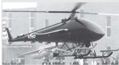
На снимке: демонстрационный полёт китайского многоцелевого БЛА вертолетного типа V750.