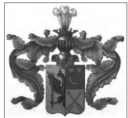
Герб рода Поливановых

рал-майора (произведён за отличие в 1899 г.) 4 , достигшего всего за полтора года поста помощника (товарища) военного министра империи. В этой должности