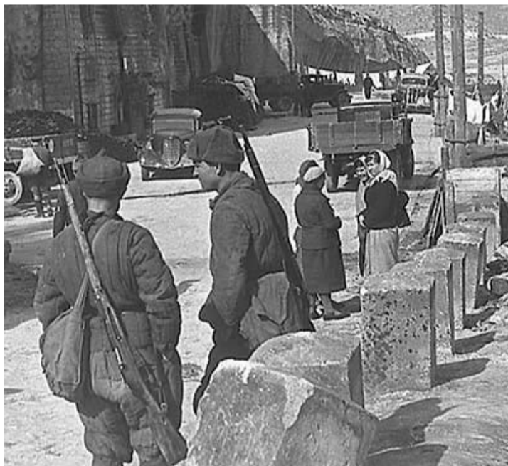
Зима 1941–1942 гг. Жизнь в Каменоломенном овраге бьёт ключом

25 июня в стену госпиталя влетел немецкий снаряд, поразив резервный дизель-генератор. Свет и свежий воздух окончательно закончились. О ремонте не могло быть и речи. К тому часу в подземельях скопилось до 2.000 раненых. Врачи и медперсонал падали с ног от усталости. 26 июня поступил приказ за две ночи вывезти всех раненых в казематы старой 24-й батареи и в здания на берегу Камышевой бухты. 27 и 28 июня большинство раненых было вывезено. 1.630 раненых госпиталя № 41 погрузили на лидер «Ташкент», ошвартованный в Камышевой бухте. Это был последний надводный корабль, прорвавшийся в Севастополь.