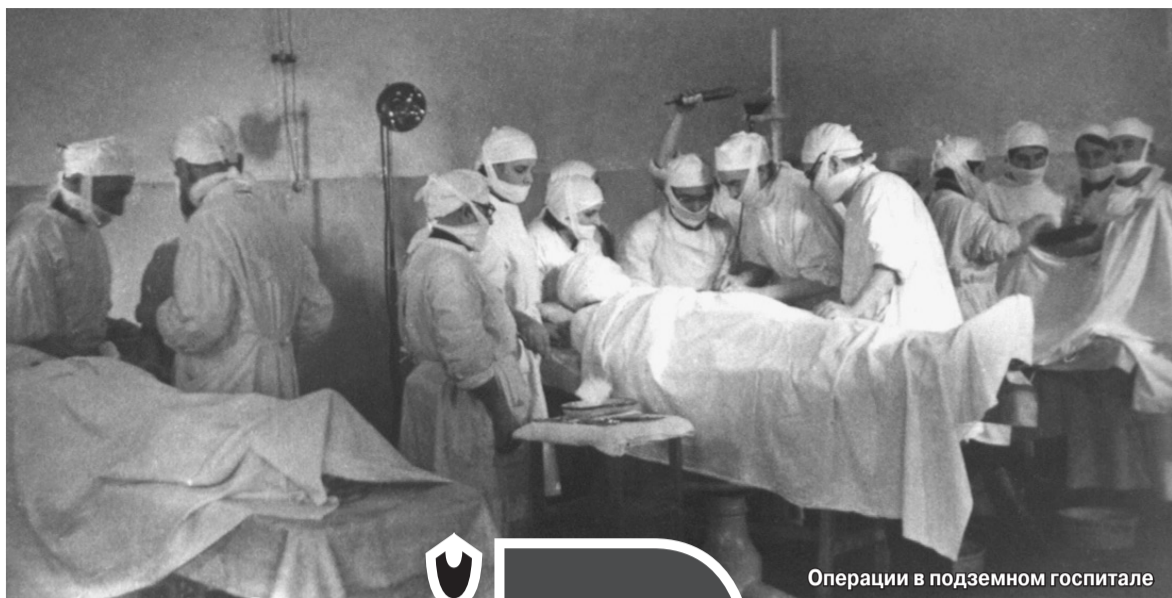
Операции в подземном госпитале